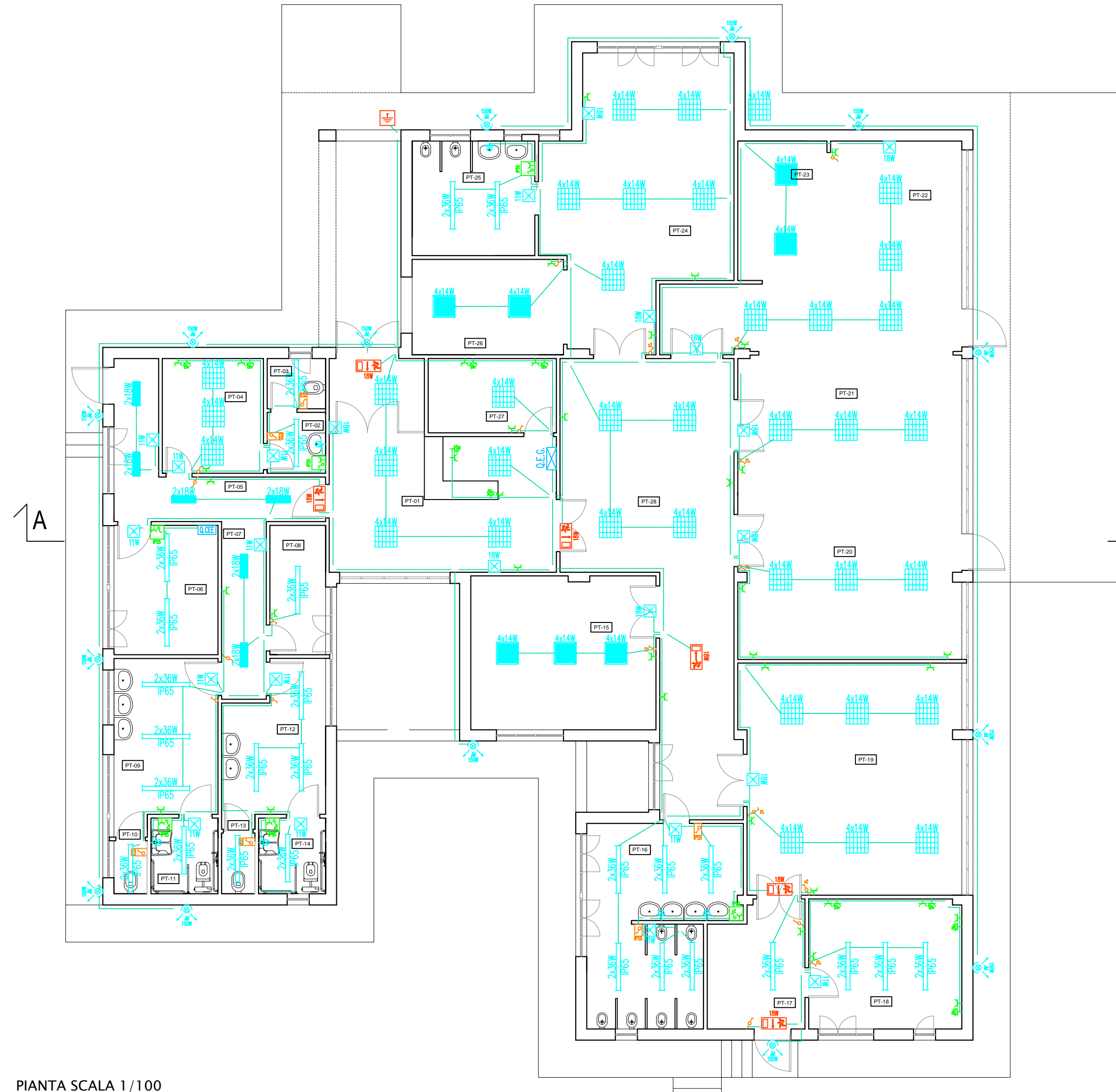
PIANTA SCALA 1/100